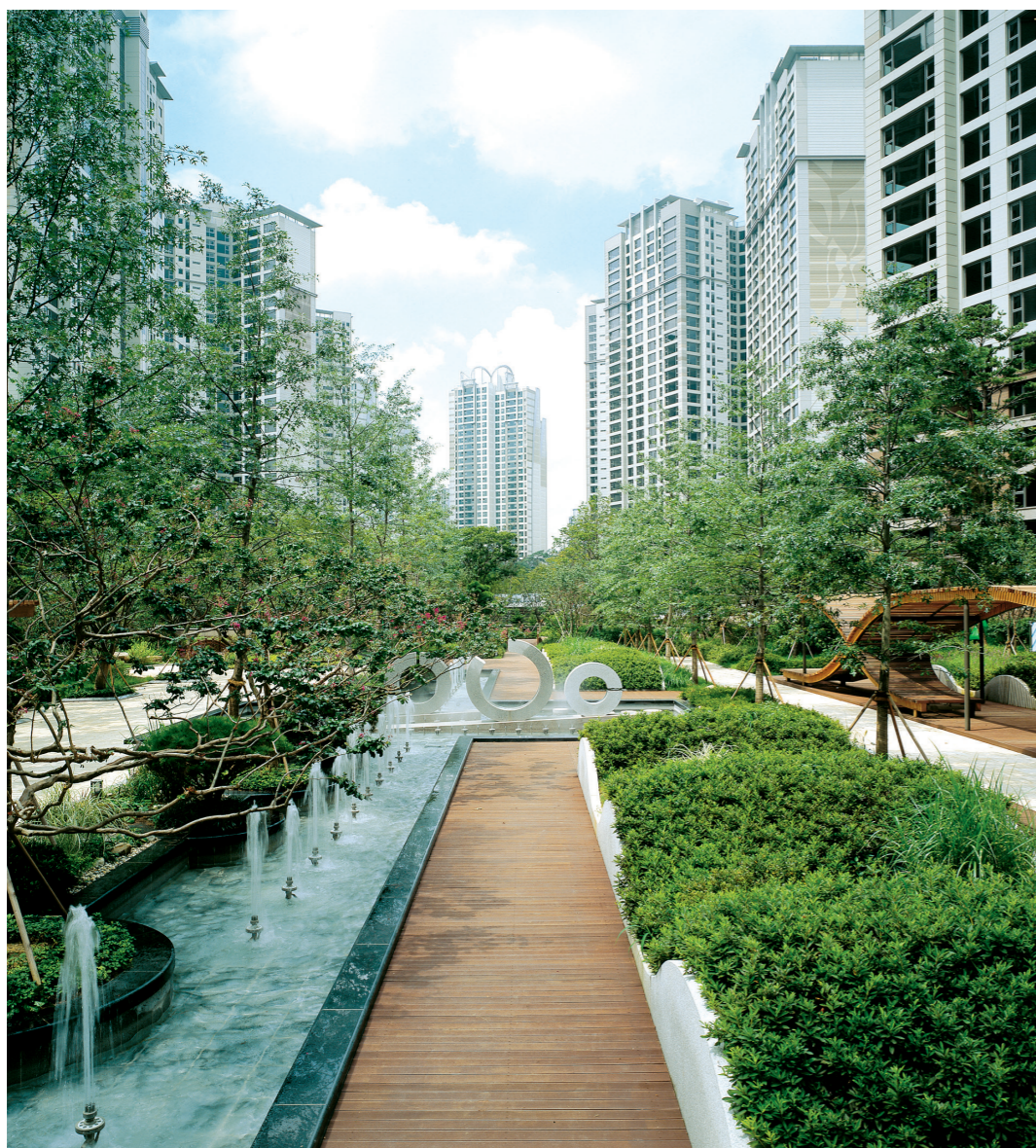
※ 상기 이미지는 GS건설에서 시공한 조경공간의 사례로서 각 단지의 실제 모습과 다를 수 있습니다.