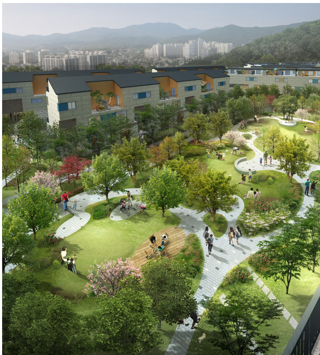
※ 상기 이미지는 소비자의 이해를 돕기 위해 제작한 것으로 실제와 다를 수 있습니다.