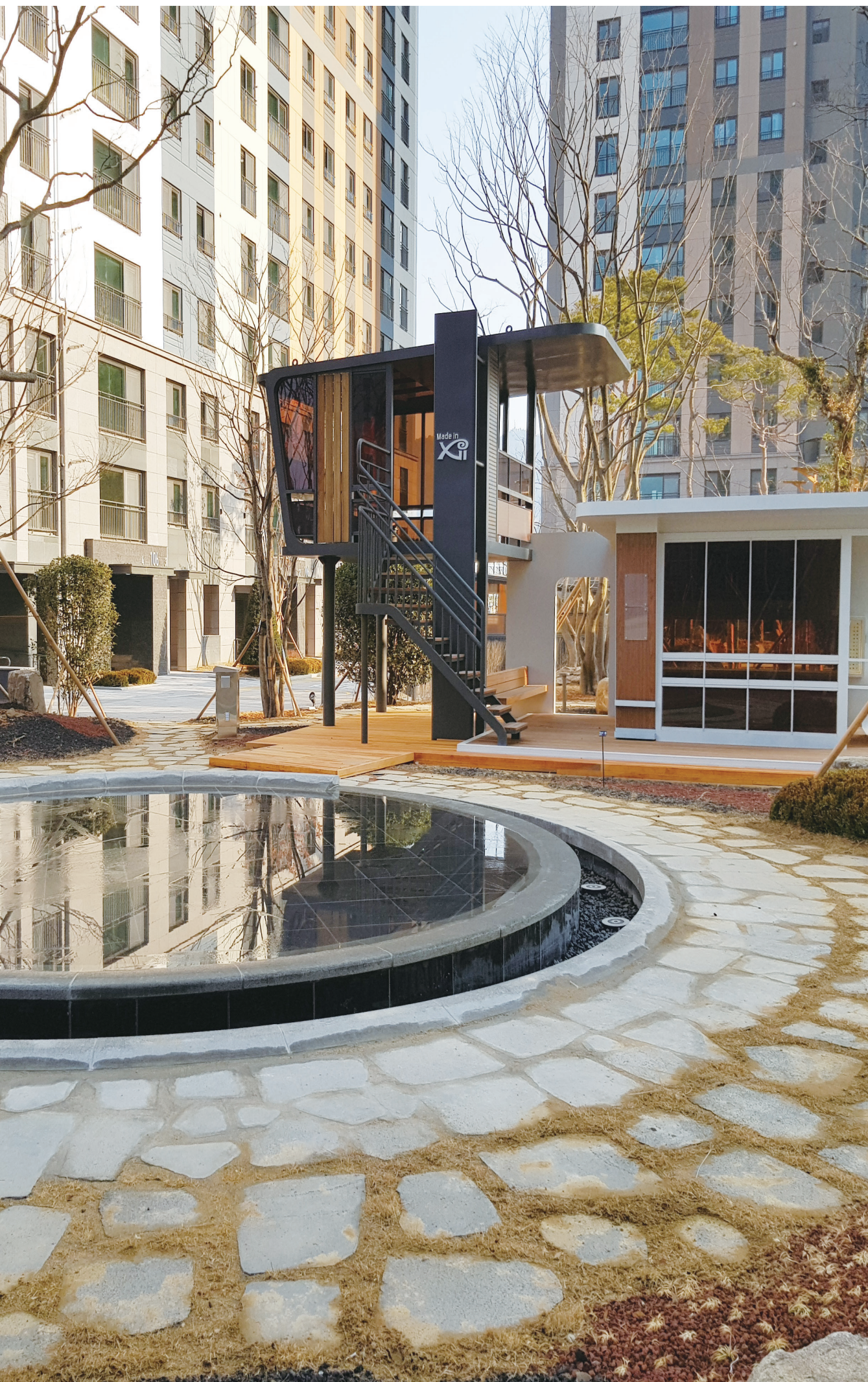
※ 상기 이미지는 GS건설에서 시공한 조경공간의 사례로서 각 단지의 실제 모습과 다를 수 있습니다.