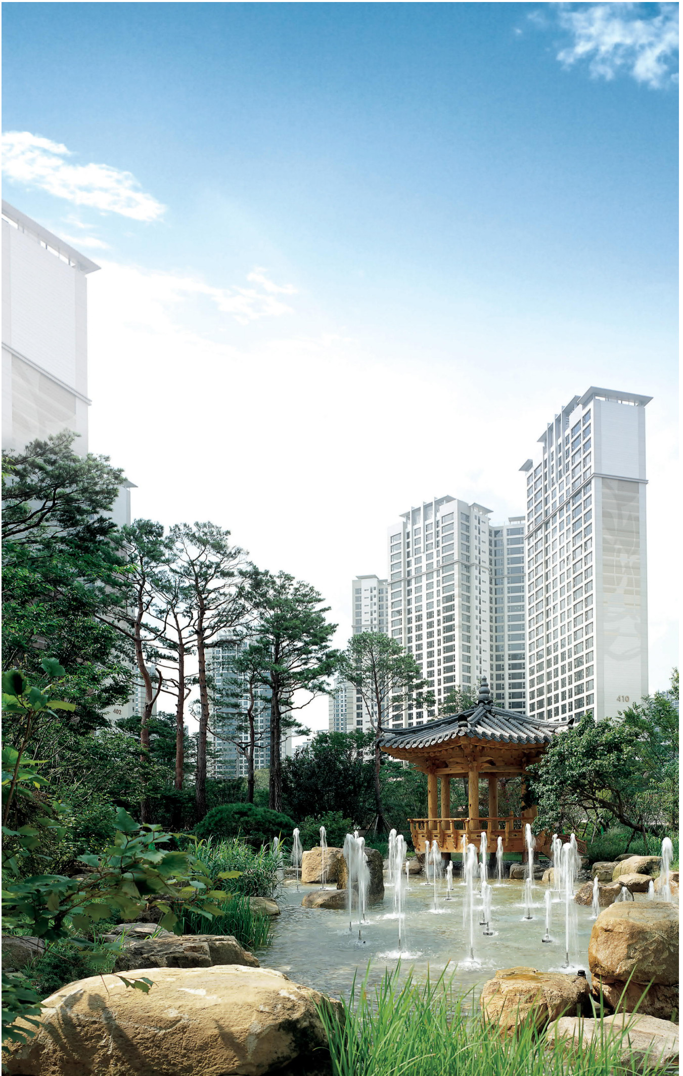
※ 상기 이미지는 GS건설에서 시공한 조경공간의 사례로서 각 단지의 실제 모습과 다를 수 있습니다.