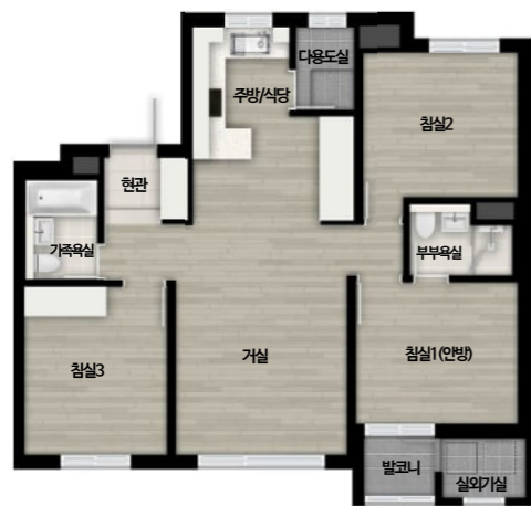
59A m (ㄷ자형)