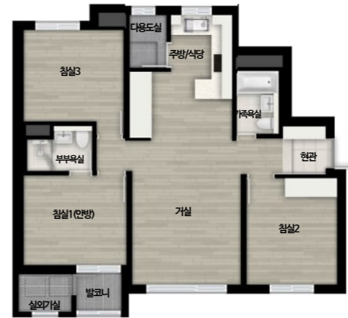
59B m (ㄷ자형)