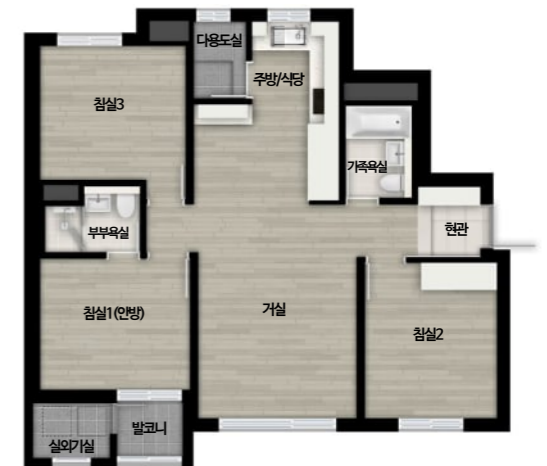
59B m (흙바형)